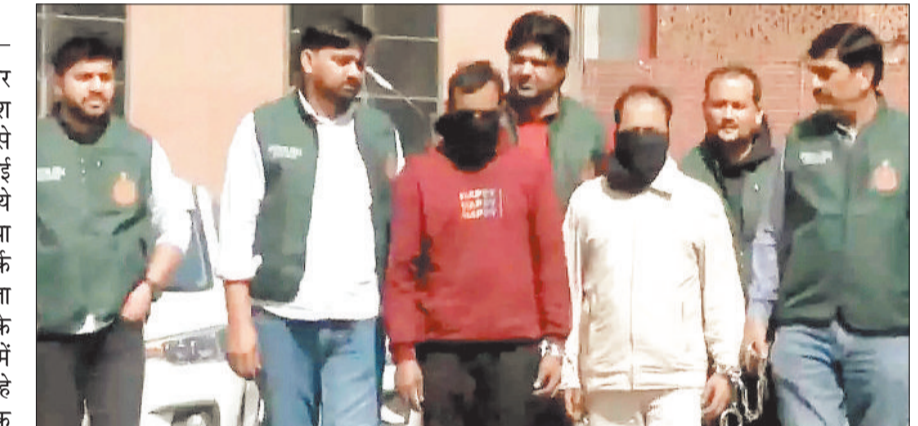
आरोपियों ने कई शहरों की रेकी की थी

सूत्रों के अनुसार, गिरफ्तार किए गए लोग बांग्लादेश स्थित आतंकी संगठनों से जुड़े हैं और उन्हें आईएसआई से फंडिंग मिल रही थी। ये सभी संदिग्ध सोशल मीडिया के जरिए एक-दूसरे के संपर्क में थे। शुरुआती जांच से पता चला है कि ये लोग भारत के अलग-अलग हिस्सों में हमलों की साजिश रच रहे थे। 18 में चार लोगों का एक ग्रुप दिल्ली आया और एआई समिट के दौरान मेट्रो स्टेशन पर फ्री कश्मीर और दूसरे विवादित पोस्टर लगाए। इसके बाद वे वापस तमिलनाडु और पश्चिम बंगाल चले गए। पुलिस ने बताया कि गिरफ्तार किए गए कुछ व्यक्ति बांग्लादेशी नागरिक हैं और उन्होंने जाली आधार कार्ड बनाया है।