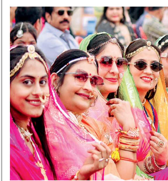
द्वंद्वी। भारतीय भाषा पर्व पर शामिल होने एकत्रित हुई राजस्थान की महिलाएं आकर्षक परिधानों में।