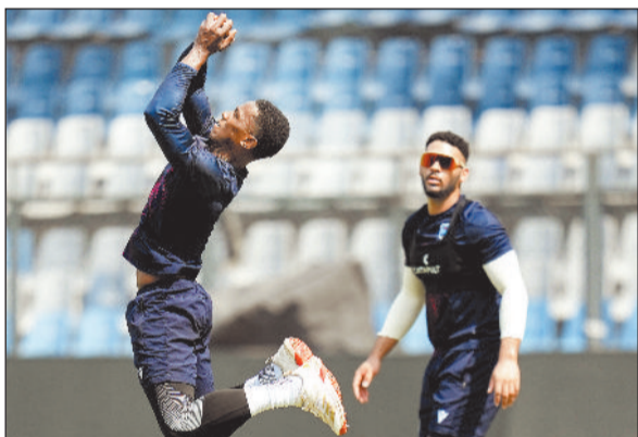
एजेसी ►► मुंबई

टी20 वर्ल्ड कप में सोमवार को जिम्बाब्वे की भिड़त दो बार की चैंपियन वेस्टइंडीज से होगी। दोनों टीमों के बीच होने वाले सुपर-8 राउंड के इस मुकाबले की मेजबानी मुंबई का वानखेड़े स्टेडियम करेगा। जिम्बाब्वे का प्रदर्शन ग्रुप स्टेज में कमाल का रहा था। टीम ने पहले चरण में ही दो बड़े उलटफेर करते हुए सुपर-8 का टिकट कटया है। जिम्बाब्वे ने पहले दौर में ऑस्ट्रेलिया और श्रीलंका को हराया था।