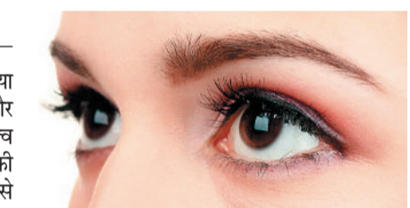
शपथ लेने वाले हजारों नेत्रदान कर्म, इसलिए पूर्व घोषणा की अनिवार्यता खत्म